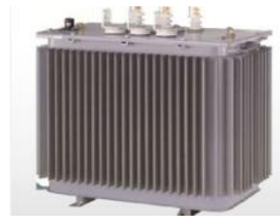
配電用油入変圧器