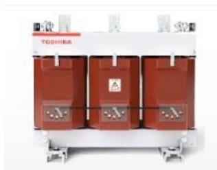
配電用モールド変圧器