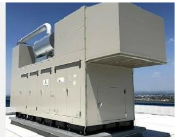
ディーゼル発電装置