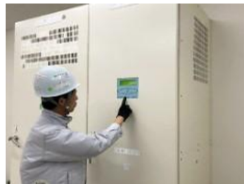
直流電源装置点検