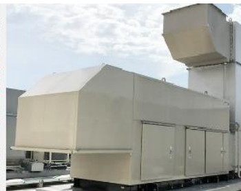
ガスタービン発電装置