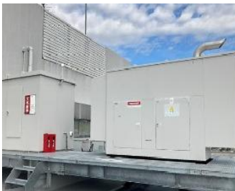
発電装置・燃料タンク